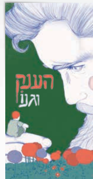
איורים: יוקסי מדר

מיועד לגני טרום חובה וחובה משך ההצגה: כ-45 דקות